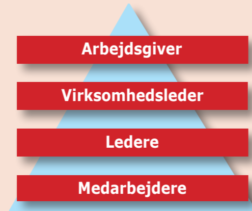
Ansvaret for arbejdsmiljøet i virksomheden